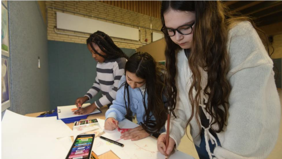
Die Fünftklässlerinnen malen zum Thema „Mobbing ist keine Lösung“.